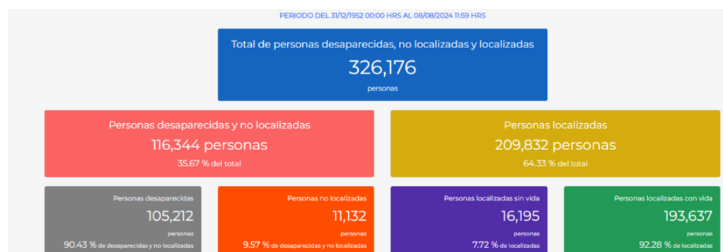
Tabla 1. Estadística del Registro Nacional de Personas Desaparecidas y No Localizada. Periodo del 31/12/1952 09:00 h al 08/08/2024 11:59 h.

Nota. El gráfico representa el contexto general de la estadística nacional relativa a la cantidad de personas reportadas: total de personas desaparecidas, no localizadas y localizadas, desglosadas como personas desaparecidas, personas no localizadas y personas localizadas con y sin vida.