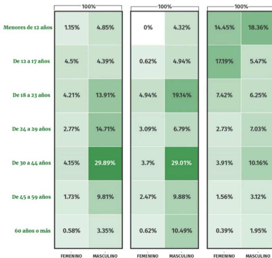
Tabla 2. Edad y sexo de las personas desaparecidas en Coahuila entre 2006 y 2017

Estudios realizados por el Centro Nacional de Planeación, Análisis e Información (Cenapi) entre 2006 y 2017 en el estado de Coahuila, entidad federativa que registra los números más altos de desaparición en este periodo, muestran que el sexo y la edad de una persona desaparecida parecerían estar sistemáticamente relacionados con la posibilidad de que ésta sea encontrada viva, muerta o continúe desaparecida. Prueba de ello es que casi 35% de las personas que han sido localizadas vivas fueron mujeres de entre 12 y 17 años. Mientras que casi 28% de las personas localizadas muertas fueron hombres de entre 30 y 44 años (tabla 2).